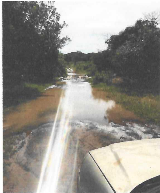
Imagem 01 e 02: Região dos Talhados