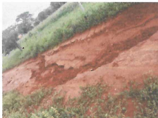
Imagem 09 e 10: Região Duas Pontes

A small, handwritten signature or mark in the bottom right corner of the page.