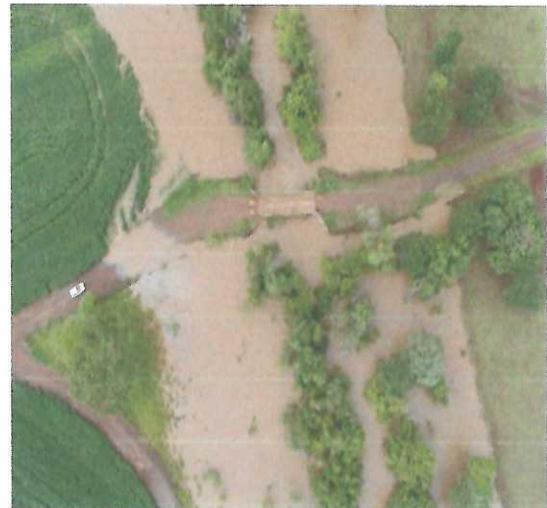
Imagem 07 e 08: Ponte da Moeda