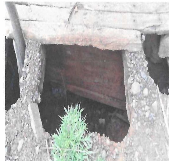
Imagem 03 e 04: Região do Zico Teodoro