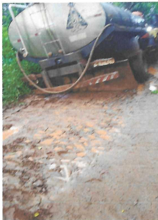
Imagem 11 e 12: Região Aroeira

Até o presente momento, a precipitação dos dois últimos meses chegou a alcançar 505,4 mm, dados fornecidos pela (Copasa Itapagipe), volume muito superior que dos últimos 5 anos no mesmo período.