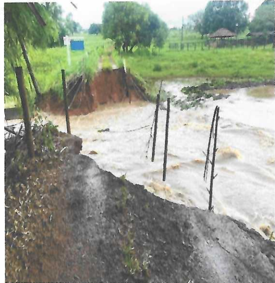
Imagem 05 e 06: Região Fortaleza de Baixo